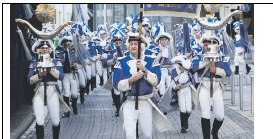
1. Gruppe: Kölner Funken Artillerie blau-weiß von 1870 e. V.

Köln – Die Macher des Rosenmontagszuges haben sich mit den Fragen beschäftigt, wie die Menschen in 50, 70, 100 oder mehr Jahren Karneval feiern, wie sie dann leben, arbeiten und wie sich unsere Stadt verändert.